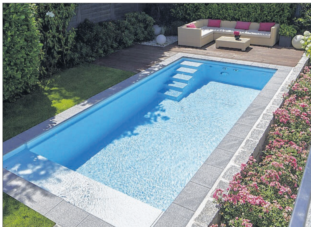
Sicher ist die Investition in einen hochwertigen Gartenpool mit umfassender Technik und passendem Ambiente nicht ganz gering - was die Nachfrage aber nicht sonderlich bremste.

Wer womöglich auf einen Preisverfall infolge der Corona-Krise spekuliert hatte, sieht sich getäuscht. Zumindest mit Blick auf die Entwicklung im ersten Halbjahr. Insgesamt wurden in diesem Zeitraum für ein freistehendes Haus 2,4 Prozent mehr gezahlt. Bei (hochwertigen) Appartements lag der Zugewinn im Schnitt gar bei 7 Prozent. Dagegen blieb das Preisgefüge für Reihenhäuser zumindest stabil. Von Krise also keine Spur! Immerhin wurde mit dieser Entwicklung bei den Appartements erstmals die „Schallmauer“ von 200.000 € durchbrochen, so Stabel, das Landesamt für Statistiken. Freilich tun sich beim näheren Blick auf die Zahlen erneut teils gravierende Unterschiede zwischen den Regionen auf. In der Wallonie etwa bleibt ein Appartement ungeachtet einer Steigerungsrate von 6,9 Prozent mit 155.000 € im Schnitt durchaus erschwinglich - im Vergleich zu Flandern mit 205.000 € (bei einer Steigerung gar von 7,9 Prozent). Von Brüssel ganz zu schweigen... Teuerste Gemeinde im Land bleibt Ixelles, gefolgt von Knokke und Woluwe-Saint-Pierre, wogegen in Hastière (Provinz Namur) und Heuvelland (Provinz Limburg) der Erwerb einer Immobilie derzeit am günstigsten ist.