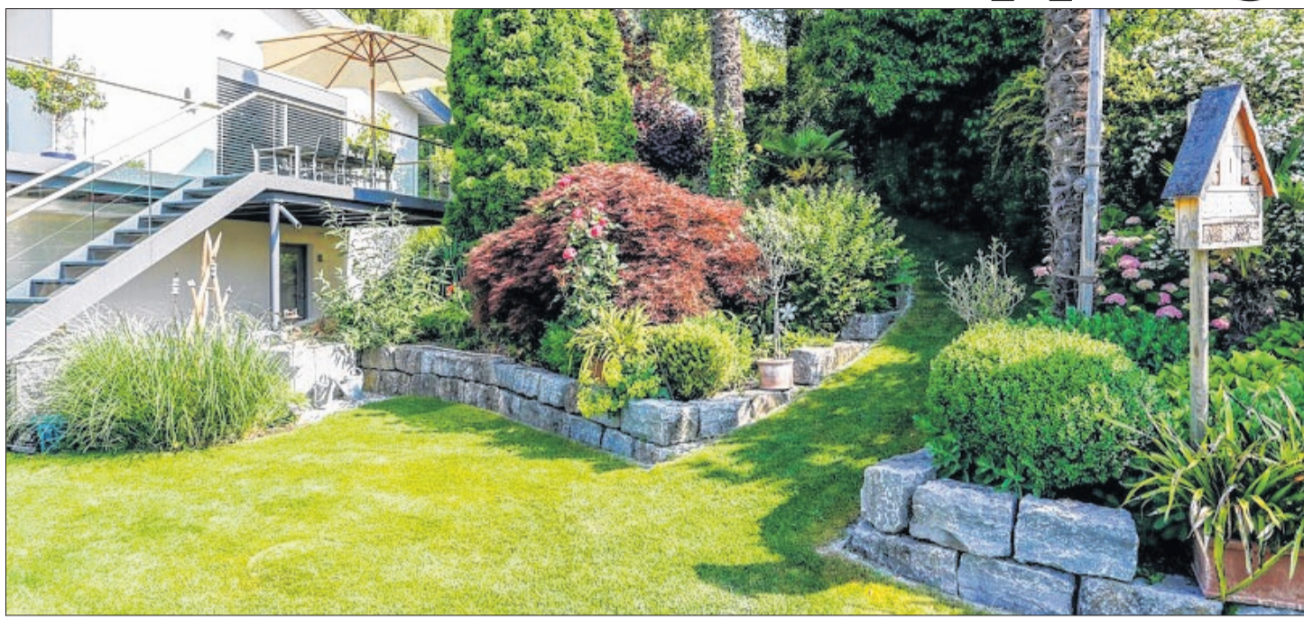
Der möglichst geräumige und „bewohnbare“ Garten am künftigen Eigenheim ist in der Zwischenzeit eine der wichtigsten Optionen, für die der potenzielle Käufer durchaus gerne um einiges tiefer in die Tasche greift.

Und während es in der Vergangenheit vielfach die gestiegene Nachfrage war, die im Wesentlichen den Preis bestimmte, ist es diesmal eher der geringe „Nachschub“. Heißt: Zunehmend mehr Eigentümer, die vor der Krise einen Verkauf