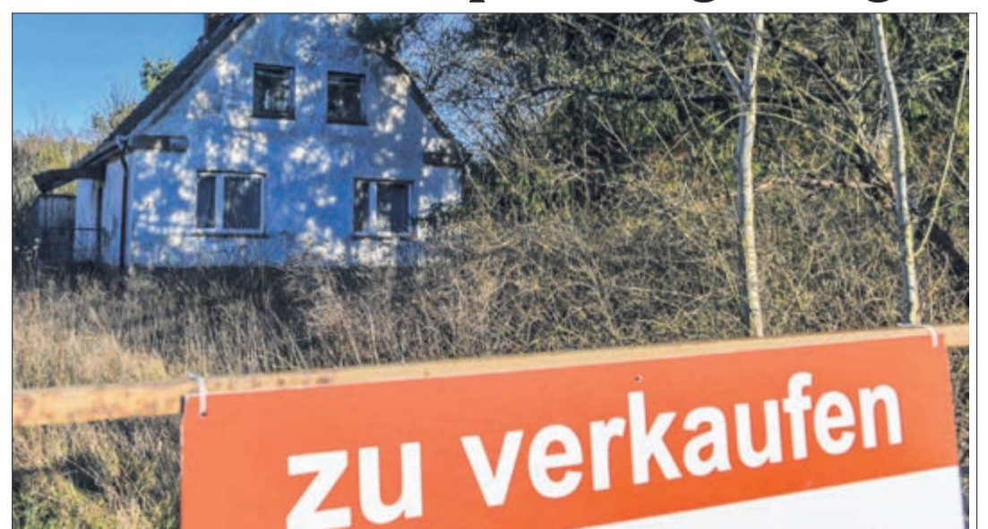
Eher „zweitrangige“ Ware bleibt derzeit ungewohnt lange „auf dem Stock“. Denn nach der Corona-Krise ist das Anspruchsdenken in puncto Wohnqualität erkennbar gestiegen.

Von daher dürften Promotoren künftig vielleicht noch intensiver als zuvor auf „soft skills“ bei der lokalen Einpflanzung von Residenzen achten, da sich die Ansprüche an die Wohnqualität infolge Corona (und etwa gestiegenem Home-Office) erkennbar geändert haben.