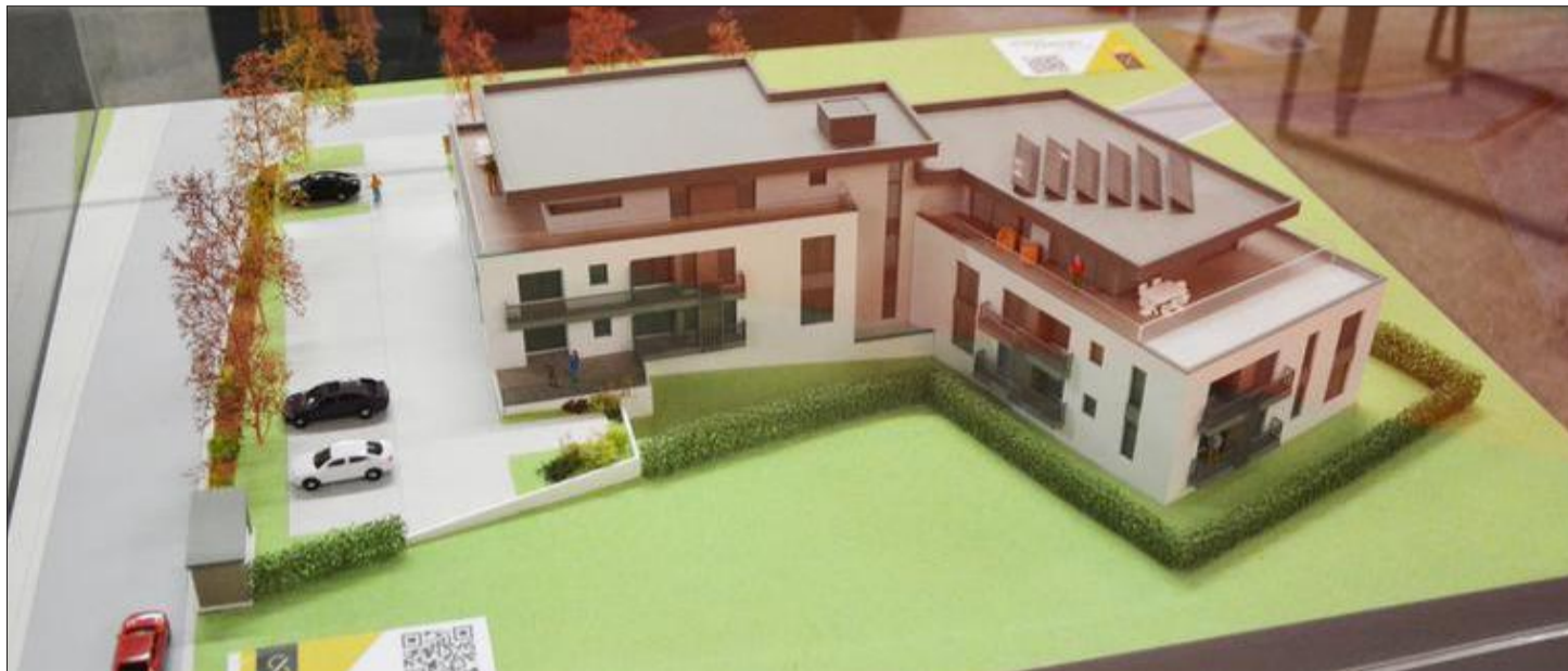
Ein Blickfang war, in exponierter Lage, das Modell der künftigen Residenz Heiderfeld an der Straße Amel-Deidenberg, die durch ihre ansprechende Architektur in optimaler Nutzung des verfügbaren Raums besticht.

Denn neue, meist durchaus zielführende Kontakte gab es nach Aussage aller Aussteller in beachtlichem Maße. Und punkten konnten die Unternehmen gleichfall durch ihre Vielschichtigkeit, die dem Besucher einen zugleich spezifischen und umfassenden Blick auf die künftigen Herausfor-