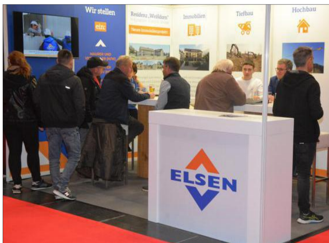
Elsen AG zählt seit einem Dreivierteljahrhundert zu den Aushängeschildern des Bauhandwerks in der Eifel, in der Zwischenzeit ergänzt um eine rege, kreative Immobilienentwicklung.