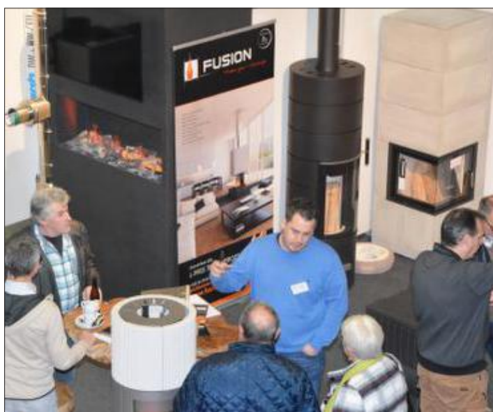
Das Spektrum war erneut breit gefächert, machte in den Bereichen Bauen und Wohnen „Appetit auf mehr“, ganz gleich ob beim Chillen am kuscheligen Kaminofen oder bei der Arbeit an der modischen Küchenfront.

Unter dem Strich bleibt eine probate Erkenntnis: Ungeachtet fortschreitender Digitalisierung und erschöpfender Informationsfülle im Netz drängt es den Käufer oder Bauherr durchaus weiterhin zum persönlichen Austausch mit (s)einem Immobilien- oder Handwerkspartner. Immerhin nachfolgend ein Dienstleister des Vertrauens.