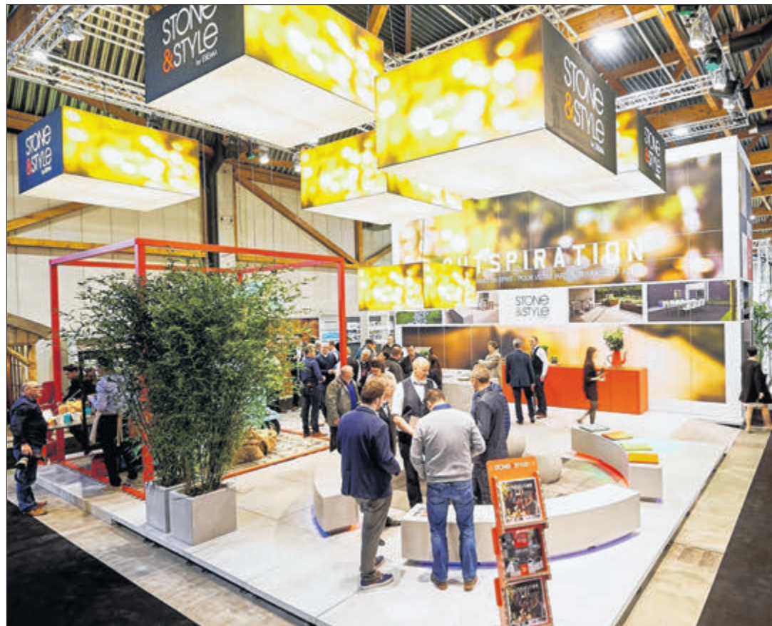
Nach wie vor beeindruckt Batibouw durch äußerst attraktive, teils überdimensionierte Stände, die anders als früher auf luftiges Design und zwanglose Interaktivität setzen.

Die Öffnungszeiten bei Batibouw sind in diesem Jahr erkennbar stärker an den Bedürfnissen des Besuchers orientiert als noch in der Vergangenheit. Gerade der Andrang nach Büroschluss soll besser kanalisiert werden (auch in Umgehung der zur „Rushhour“ befürchteten Staus um und am Messelände). So ist die Expo unter der Woche von 12 bis 20.30 Uhr zugänglich (plus am Donnerstag, 5. März, bis 22.30 Uhr), am Wochenende weiterhin von 10 bis 18.30 Uhr. Zugleich offeriert Batibouw mittels der Aktion „Afterwork“ einen kostenfreien Zugang an den vier Wochentagen Montag, Dienstag, Mittwoch und Freitag ab 16 Uhr - via ein Ticket, das der Besucher vorab durch eine Registrierung im Internet „erstehen“ kann ( www.batibouw.com ). Überhaupt ist der Erwerb eines regulären Online-Tickets um 1,50 € günstiger als an der Tageskasse (13,50 € gegenüber 15,00 €). Bleibt die Frage, ob diese Initiativen umgehend greifen und vor allem die Stoßzeiten ein wenig entkrampfen. Und ob erneut über eine Viertelmillion Besucher den Weg zu den Messehallen auf dem Heysel-Plateau finden. Zum Vergleich: Im Vorjahr lösten zum Jubiläum 257.000 Gäste ein Ticket bei Batibouw.