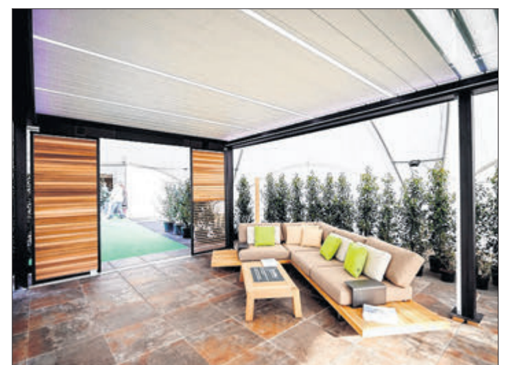
Individuelle Wohnkultur findet heute auch erkennbar ihren Niederschlag in der Gestaltung des hauseigenen „open air“.

Vier Wohn„angebote“, gruppiert um einen gemeinsamen Garten, der für das „Kollektiv“ steht, zu dem sich die Bewohner ungeachtet ihrer unterschiedlichen Philosophie zusammenfinden können. Und in ihrer individuellen Inspiration von den Vorzügen der Wohnkultur des Nachbarn profitieren.