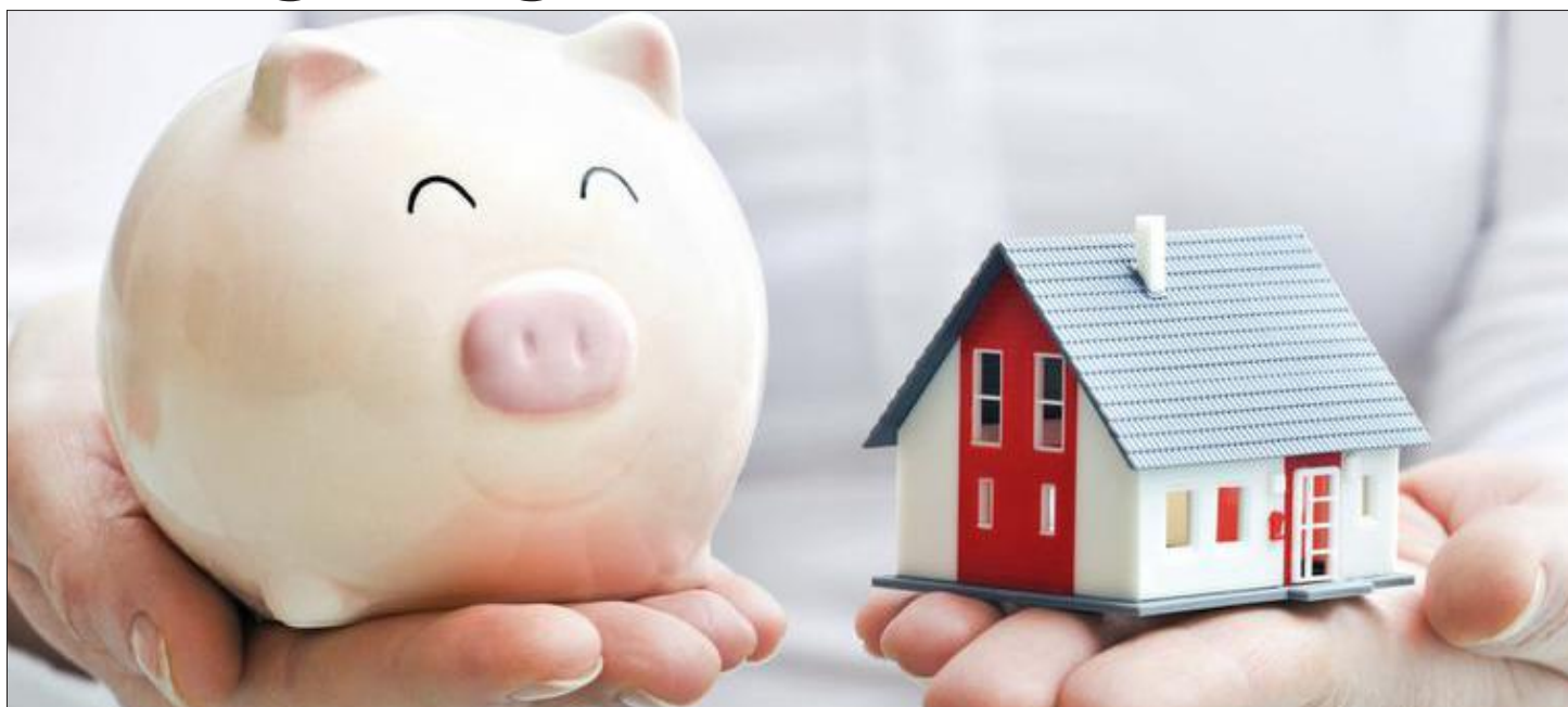
Die beständige Zinserhöhung durch die EZB macht Investitionen zunehmend „teurer“, zugleich wird das Sparen plötzlich wieder attraktiv(er), während der Konjunkturmotor ins Stocken gerät.

Unbestreitbarer Fakt ist, dass die Inflationsraten in Europa auf hohem Niveau verharren - merklich über dem Ziel der EZB für Preisstabilität. Sicher können Zentralbanken mit gezielten Zinserhöhungen die Inflation bremsen, jedoch im Wissen, dass höhere Zinsen auf die Konjunktur „drücken“