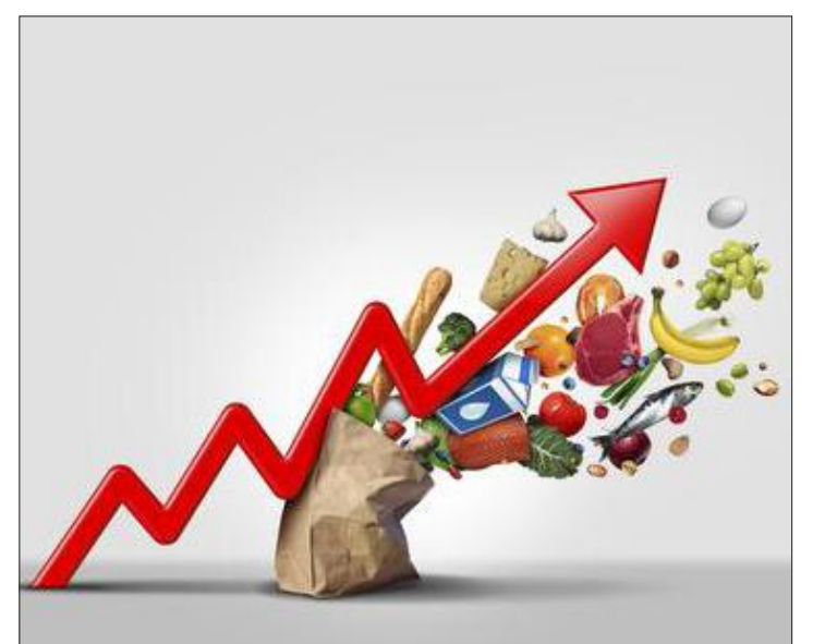
Nur ein baldiges Rezept gegen die galoppierende Inflation schafft ebenfalls neue Anreize auf einem stagnierenden Markt.

Dennoch: Die lange Epoche extrem günstiger Immobilienfinanzierungen dank maximal niedriger Zinsen erklärt die Branche für beendet. Eine Verteuerung, die den jahrelangen Immobilienboom (vorerst) bremst. Die merklich schlechteren Konditionen führen dazu, dass die Raten für Zins und Tilgung um Hunderte Euro höher liegen als zuvor (und somit als geplant), was den Immobilienkauf für viele unbezahlbar macht. Die Folge: Die Preise für Wohnungen und Häuser sind im Schnitt leicht gefallen.