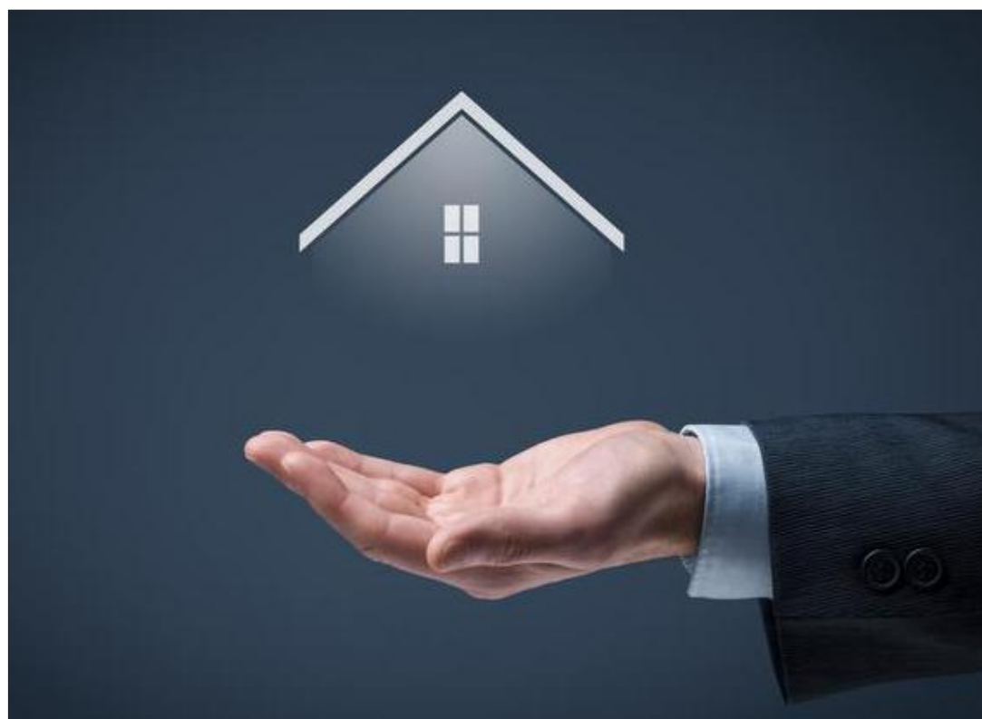
Besonders aufgrund der Verteuerung der Wohnkredite infolge der unerwartet schnell und stark gestiegenen Zinsen wird das Eigenheim in der Zwischenzeit für viele zur Illusion.

Die Zahl der neuen Hypothekenkredite erreichte im Februar in Belgien ein historisches Tief, letztlich der finale Beleg für die Stagnation auf dem Immobilienmarkt. Lediglich 16.165 Wohnkredite (wahlweise für Kauf oder Bau) sind der niedrigste Wert, den die Belgische Nationalbank seit eineinhalb Jahrzehnten registriert hat. Konkret: Seit 2007, als das offizielle Kontrollorgan in Form der „Centrale des crédits aux particuliers“ (CCP) die Datensammlung zur Kreditvergabe gestartet hat. Besagte Zahl lag faktisch nur bei der Hälfte der Kredite vom Vormonat Januar, der mit 32.600 Vergaben bereits weit „unter dem Soll“ der Vorjahre lag. In Zahlen: In den fünf Jahren zuvor wurden im Januar durchweg um die 65.000 Wohnkredite gebilligt. Gegenüber den beiden Vergleichsmonaten des Vorjahres bedeuten diese Zahlen einen Einbruch von stattlichen 47 Prozent. Eine stärkere Abkühlung hat der belgische Immobilienmarkt noch nie zu Beginn eines Jahres gekannt. Hierzu eine weitere Zahl: Laut Erhebung der Fédération des Notaires sanken die Transaktionen in den Notarstuben im zweiten Semester des vergangenen Jahres um richtungsweisende sieben Prozent.