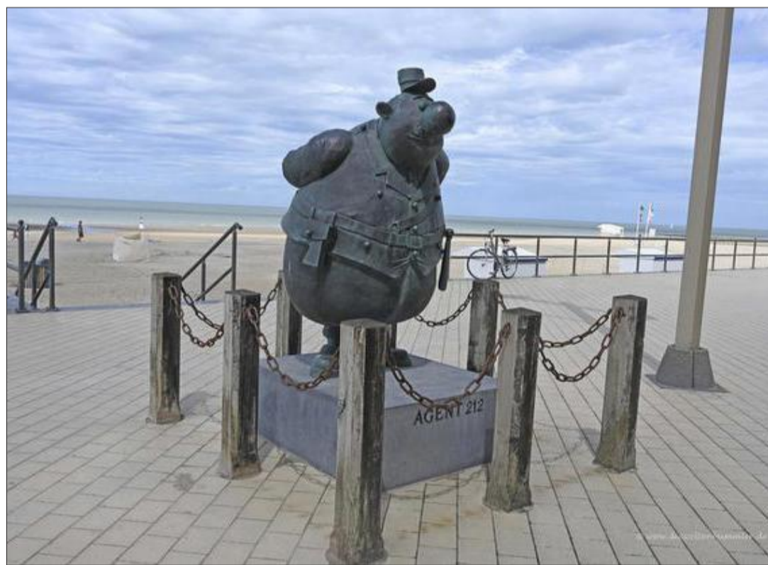
Die belgische Küste hat vielerorts deutlich mehr zu bieten als Dünen und Strand, so u.a. Middelkerke mit seiner Dauerausstellung bekannter belgischer Comicfiguren.