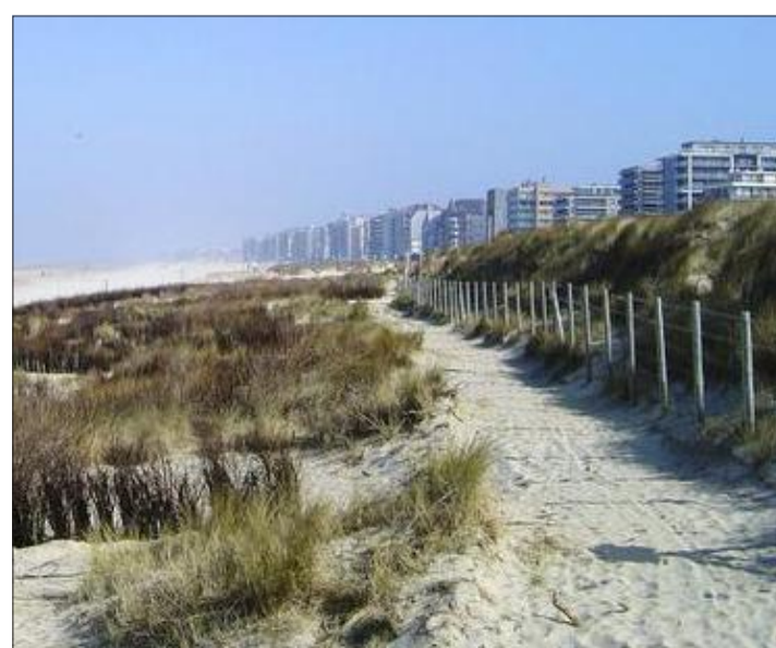
Mancherorts ist entlang der „digue“ das Investitionspotenzial ausgeschöpft. Zudem besteht teils hoher Renovierungsbedarf.

Unübersehbar ist der Rückgang bei neuen Appartements am Markt - mit 14,5 Prozent der größte Wert in den vergangenen fünf Jahren. Hier hat einerseits die plötzlich und brachial gestiegene Nachfrage im Zuge der Pandemie den Markt regelrecht „abgegrast“, andererseits haben die Schwierigkeiten im Bausektor (vor allem teils stark gestiegene Materialpreise und wackelige Lieferketten) nicht im gleichen Maße „für Nachschub sorgen“ können.