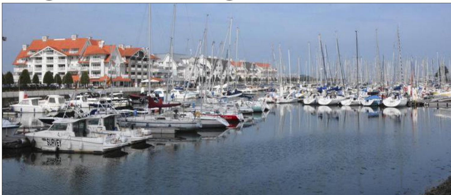
In puncto Attraktivität und Nachfrage weist die belgische Küste ein teils sehr starkes Nord/Süd-Gefälle auf. Zu den Aufsteigern der letzten Jahre zählt unbestritten Nieuwpoort mit seinem Jachthafen.

In Zahlen: Nach den jüngsten Erhebungen der Fédération des Notaires (kurz: Fednot) verzeichnen die Appartements an der „digue“ einen Rückgang um 5 Prozent, wogegen